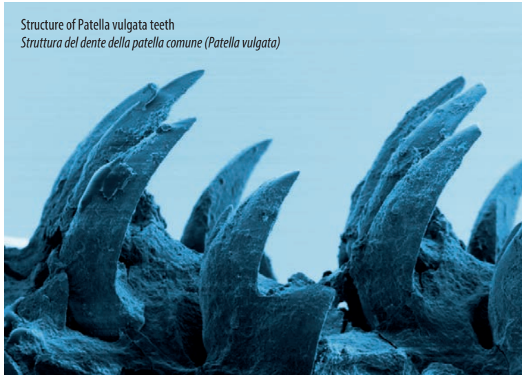
Structure of Patella vulgata teeth Struttura del dente della patella comune ( Patella vulgata )