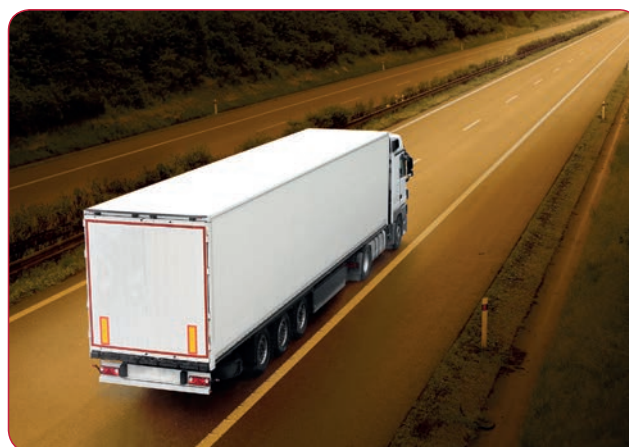
Fig. 3 Le soluzioni d'anima a nido d'ape riducono i consumi di combustibile aumentando i ritorni economici