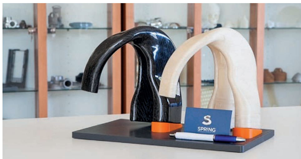
Soluble mandrel to create complex geometries Mandrino solubile per la creazione di geometrie complesse

Il settore dei compositi ha caratteristiche proprie: volumi produttivi talvolta ridotti alla singola parte, elementi complessi e tempi di realizzazione molto ridotti. Efficienza, precisione e velocità sono parole chiave nel settore. Spiega Roberto Toniello: “Il nostro servizio permette alle aziende di creare e produrre delle valide attrezzature per il supporto