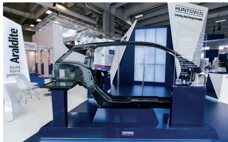
Side frame and other composite parts of the BMW i Carrozzeria laterale e altre parti in composito per la BMW i

For example, once the PAN precursor for the carbon fibre is manufactured in Otake, Japan it is transported to Moses Lake, Washington to benefit from the relatively inexpensive hydroelectric power provided by the BMW dedicated facility run by SGL Automotive Carbon Fibers (SGL ACF). From here, the carbon fibre roving is sent to another SGL ACF facility in Wackersdorf, Germany, where