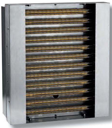
IR QUARTZ MODULE AND CONTROL SYSTEM

Helios Italquartz S.r.l. since 1940 is specialized in the production of quartz glass items, quartz based scientific equipments and ultraviolet (UV) lamps. Helios is one of the worldwide leaders in infrared (IR) quartz emitters production in single and twin tube emitters in short, medium and fast medium wavelength.